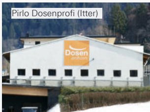
Pirlo Dosenprofi (Itter)