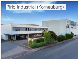
Pirlo Industrial (Korneuburg)