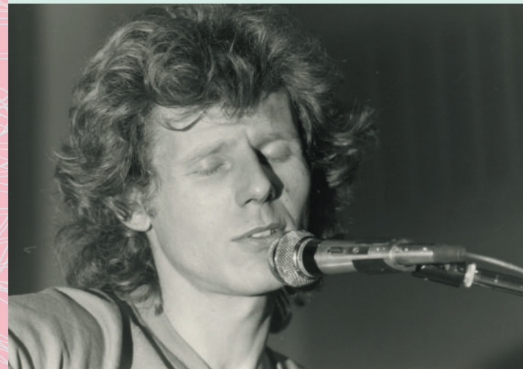
Georg Danzer in Kufstein, 1975 oder 1976