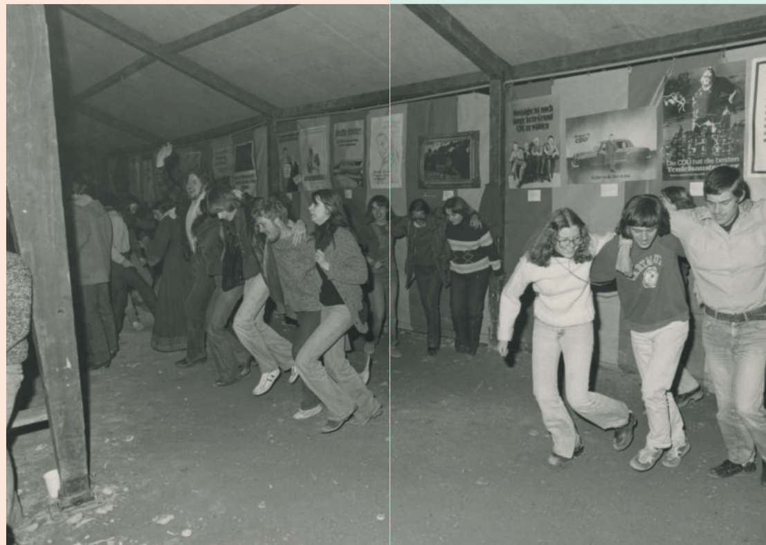
Junge Burg im Exil, Kufstein, 1977

Schon am Beginn der Arbeit der Wühlmäuse gab es im Club zwei inhaltliche Ausrichtungen: Neben dem erwähnten Kulturschwerpunkt wurde das Ziel eines selbstverwalteten Jugendzentrums verfolgt. Österreichweit waren die Wühlmäuse für die Alternativkultur Avantgarde. In Innsbruck gab es noch nicht das Komm, aus dem später das Treibhaus hervorgehen sollte, in Wien war die Arena-Bewegung erst im Entstehen. Hunderte Veranstaltungen sollten in den