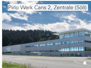
Pirlo Werk Cans 2, Zentrale (Söll)