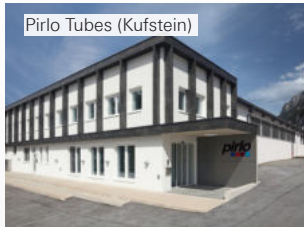
Pirlo Tubes (Kufstein)