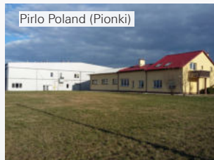
Pirlo Poland (Pionki)